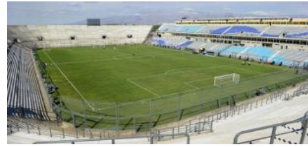
Estadio Brigadier General Estanislao López

13 º partido (10-07-11) Colombia- Bolivia