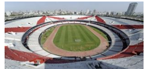
Estadio Antonio Vespucio Libertri

El mes más frío es julio. En invierno, el frío es moderado durante el día pero intenso durante la noche.