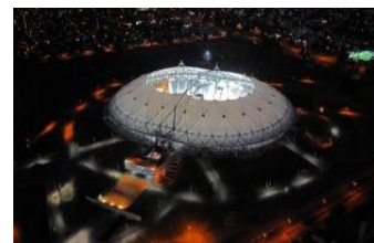
Estadio Ciudad de La Plata

Capital de la Provincia de Buenos Aires, ubicada sobre la Pampa Húmeda, a 56 kilómetros al sudeste de la Ciudad de Buenos Aires.