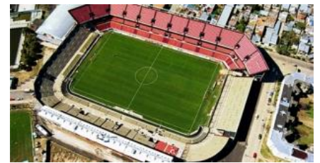
Estadio del Bicentenario