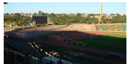
Estadio Mario Alberto Kempes

Región central de Argentina. Altitud 352-544m.