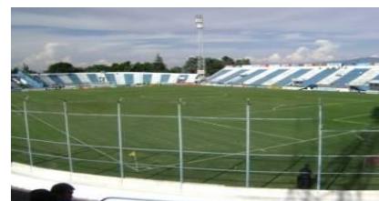
Estadio 23 de Agosto