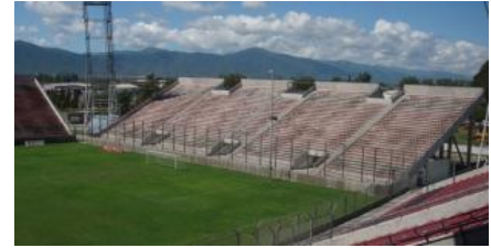
Estadio Padre Ernesto Martearena