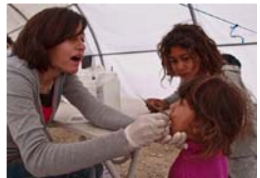
Un niño recibe un suplemento de vitamina A durante una campaña de vacunación contra el sarampión y la meningitis que recibió apoyo de UNICEF en el campamento de refugiados sirios de Domiz, en Irak.

En respuesta a un llamamiento a la vacunación realizado por los equipos de movilización social de UNICEF en el campamento, la mayoría de la población que cumplía con las características aprovechó la campaña. Ubicados en tres tiendas de campaña dedicadas a la inmunización, los profesionales de salud administraron inyecciones contra la po-